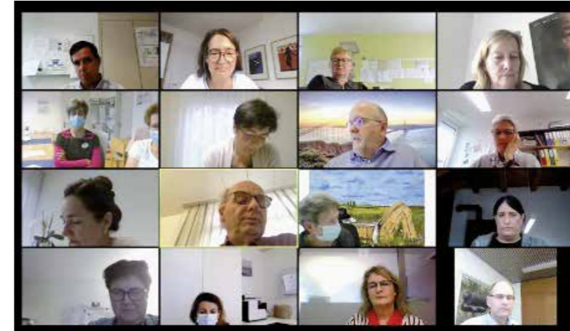
Corona-Austausch via Zoom