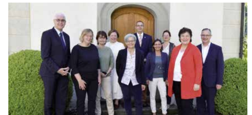
Regierungsratsbesuch in Schloss Eppishausen, Erlen.

Der Abschluss des Besuchs stellte ein entspanntes Mittagessen auf der Terrasse des Sattelbogens dar, den alle Beteiligten als wohltuende Auszeit in dem Coronageprägten Alltag empfunden haben.